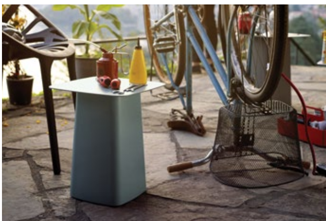
Metal Side Table (Outdoor)

Les Metal Side Tables galvanisées, dotées en option d'une finition époxy finement structurée, sont des tables d'appoint résistantes aux intempéries et disponibles en plusieurs tailles.